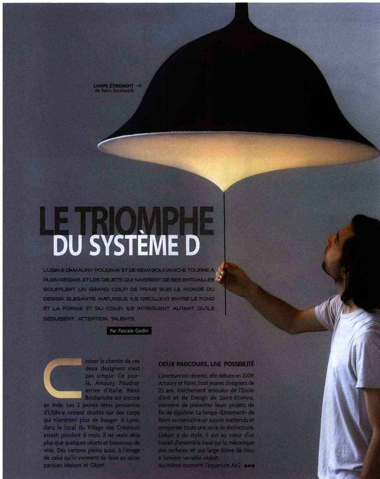
LAMPE ÉTIREMENT — de Rémi Bouhanich